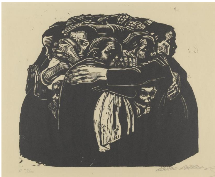
Slika 11. Lijevo: Käthe Kollwitz, The Widow I, 1921./Slika 12. Desno: Käthe Kollwitz, The Mothers, 1921./2.