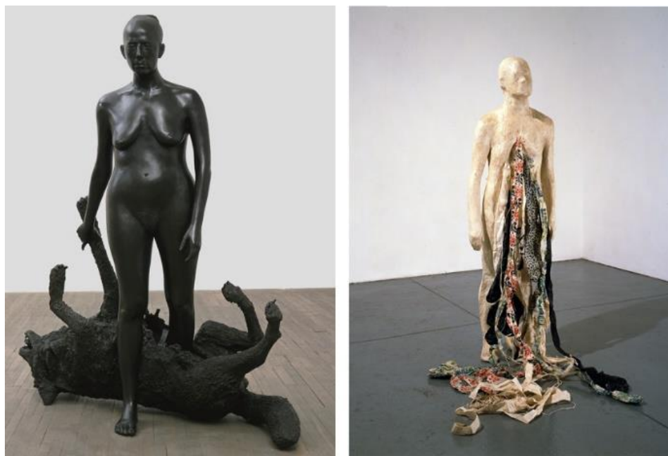
Slika 8. Lijevo: Kiki Smith, Rapture , 2001./ Slika 9. Desno: Kiki Smith, Untitled , 1992.

U svojim radovima prikazuje degenerativnu prirodu tijela te oni izazivaju morbidnu znatiželju o smrti i propadanju. Poveznica i inspiracija koju pronalazim u njenim radovima leži u fascinaciji anatomijom, ženskim tijelom, ali i u prikazivanju unutarnjeg svijeta i mističnih elemenata kroz prikaz ljudske figure koja je ponekad pasivni objekt mučenja i zlostavljanja, ali može se i regenerirati i doživjeti ponovno rođenje. 40