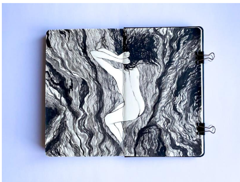
Slika 16. Skica iz sketchbooka, kombinirana tehnika, Petra Arežina, 2023.

U ovom odlomku pojasnit ću način rada pravokutnih grafičkih otisaka pod nazivima „Utočište 1 i 2“. Crteži iz sketchbooka poslužili su mi kao inspiracija za izradu pravokutnih dviju grafika. Oba su crteža nastala spontano bilježenjem toka misli u sketchbooku . Sketchbook se definira kao blok s praznim stranicama za skiciranje. Umjetnici ga često koriste za crtanje ili slikanje kao dio svog kreativnog procesa. Neki ga koriste za skiciranje nacрта za buduća umjetnička djela. 45 Na taj sam ih način i ja koristila. Pri izradi crteža koristila sam lavirani tuš i rapidograf, kojima sam nizala tanke linije kako bih sagradila snop nastao od crnih poteza kistom. Kroz autoportret pozicioniram lik unutar zamišljenog prostora gdje gradim svoje sigurno utočište. Prvu sam matricu obradila izričito samo u bakropisu, dok sam na drugoj nadodala tanke slojeve reservagea kako bih zagustila prostornu vrijednost. Linije bakropisa od kojih je satkana šupljina u kojoj se figura nalazi bile su fine i tanke, dok je vanjski prostor načinjen od tamnijih, debljih linija jačeg intenziteta. Obrisnu liniju figure gradila sam debljim linijama, a tanjim isprekidanim sam na nju dodavala detalje. Kosa je satkana od gustih tankih linija koje su u kontrastu sa samom figurom, radi ekspresivnog nizanja, odnosno graviranja.