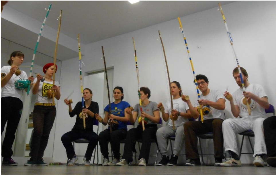
Slika 3 i 4. Berimbau