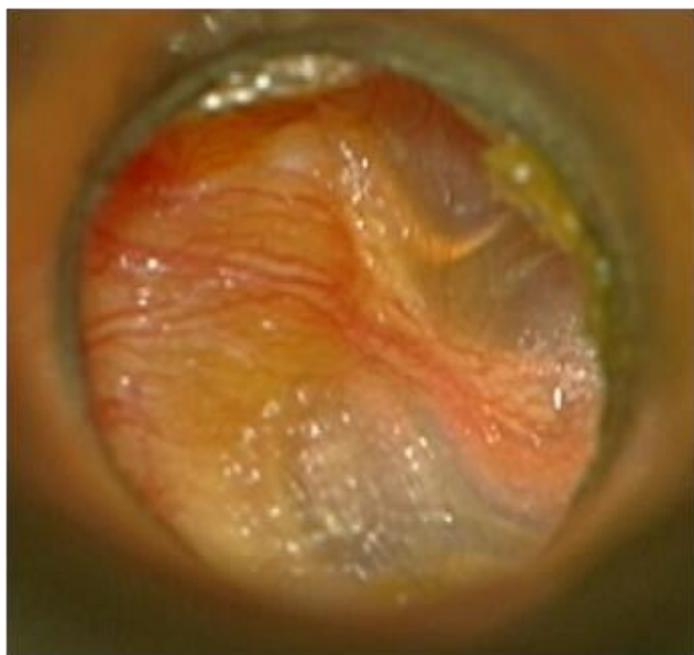
Slika 1. Sekretorni otitis Figure 1 Secretory otitis media