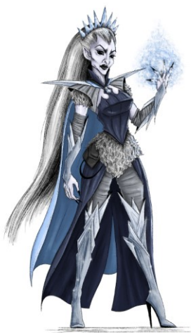
Slika 8. Finalna ilustracija vještice