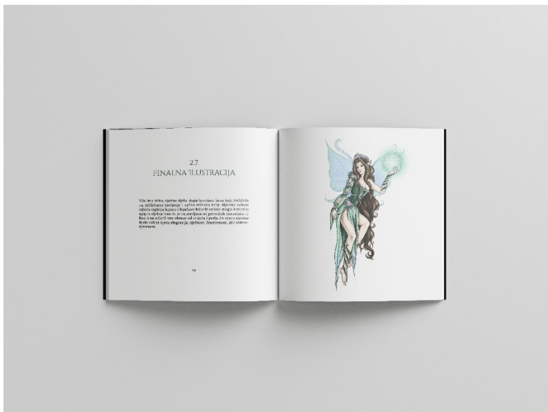
Slika 14. Mockup, prijelom artbooka, str. 20 - 21