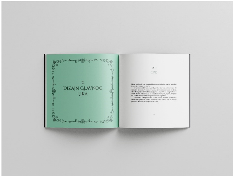
Slika 13. Mockup, prijelom artbooka, str. 8 - 9