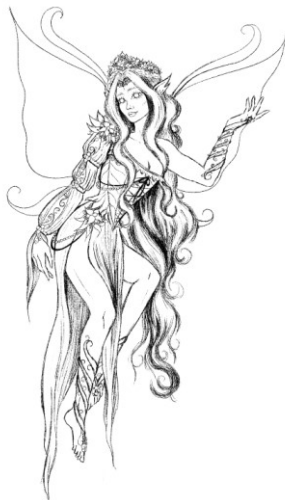
Slika 2. Finalna skica vile