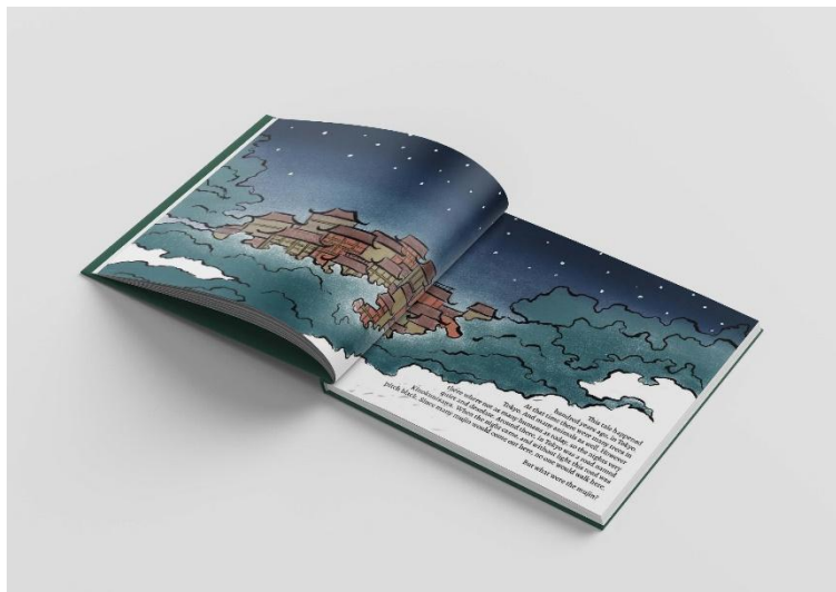
Slika 8. Mockup slikovnice, stranice 1-2