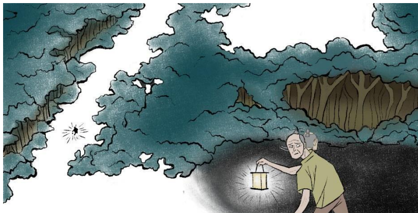
Slika 5. Primjer spajanja dvije ilustracije