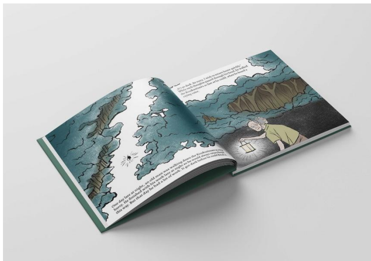
Slika 9. Mockup slikovnice, stranice 3-4