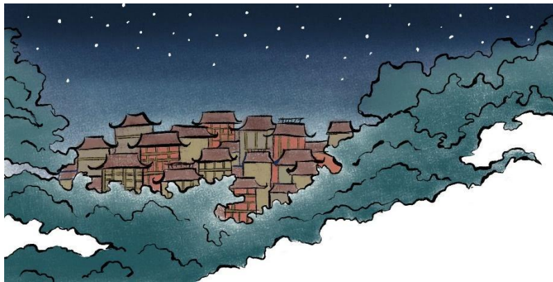
Slika 6. Primjer upotrebe negativnog prostora