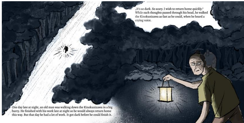
Slika 4. Razrada stila