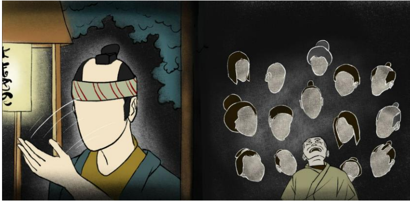
Slika 7. Primjer korištenih boja