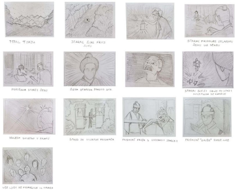
Slika 1. Knjiga snimanja