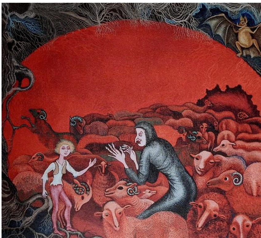
Slika 6. Ilustracija za priču "Jagor" Ivane Brlić Mažuranić, 1970.

Proučavajući razne umjetnice u crtačkom mediju pozvala bih se na djela Cvijete Job. Slikarica i ilustratorica minijatura Cvijeta Job rođena 6. kolovoza 1924., a umrla je 18. lipnja 2013. godine. Bavila se slikanjem minijatura koje su je nadahnjivale, a posebice onima srednjovjekovne rane renesanse. Najveći ilustratorski opus Cvijete Job bile su pripovijetke Ivane Brlić Mažuranić. U svojim minijaturama često koristi elemente nadrealizma. 37 Hrvatskoj je javnosti najpoznatija po ilustracijama dječjih knjiga kao što su Puškinove i Andersenove bajke, slikovnice prema pričama Ivane Brlić-Mažuranić, poznatu bajku Petra P. Jeršova „Konjić Grbonjić“, „Lovačke zapise“ Ivana Sergejeviča Turgenjeva i djela Petra Šegedina. 38