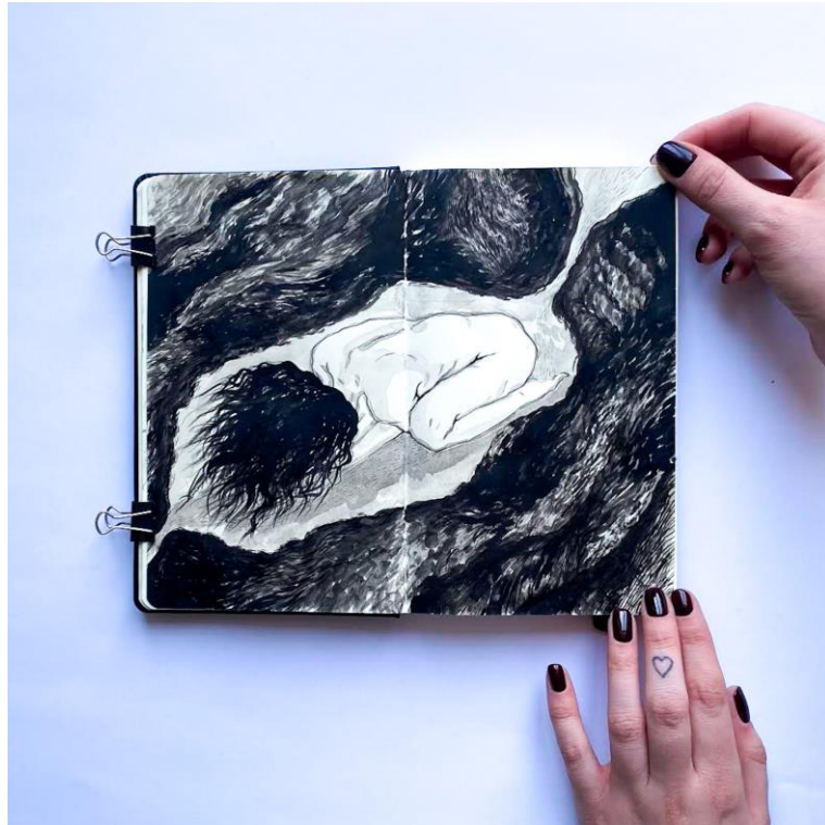
Slika 17. Skica iz sketchbooka, kombinirana tehnika, Petra Arežina, 2023.

Prvi autoportret na pravokutnom otisku okrenut je leđima te je smješten u samom centru, a u samoj dužini obavijen je tankim linijama. Figura prekriva svoje lice rukama istežući se kao da se budi iz sna te se stapa s prostorom. Stijenke tog prostora naznačavam ekspresivnim linijama čiji potezi naglašavaju njihovu dinamičnost. Raspon tonova u grafičkoj tehnici stvaram kroz gustu slojevitost linija i njihovu samostalnost. Figura na drugome radu prikazana je u zgrčenom položaju, te joj je lice okrenuto prema tlu i prekriveno kosom. Smještena je u šupljini koju štiti ambijent izgrađen od gustih, tamnih stijenki, već spomenutog organskog prostora. Ta se šupljina sužava prema izlazu iz formata te kroz nju gradim kratkim, oštrim linijama tijekom kojih daje tek naznaku da se do nje može doprijeti izvana. Organski elementni prostora se zgušnjavaju oko šupljine u kojoj je smještena figura te joj time daju na osjećaju zaštite.