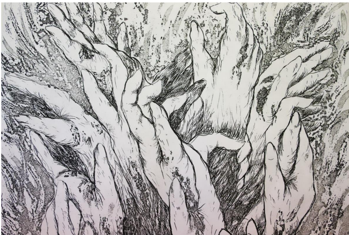
Slika 24. Detalj iz grafičkog lista „Zagrljaj“, kombinirana tehnika, Petra Arežina, 2023.