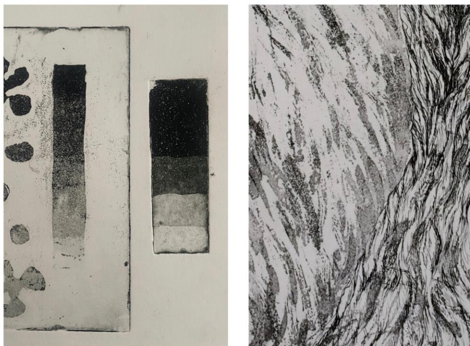
Slika 1. Lijevo: Skala tonova autorice Melinde Kostelac za grafički list „Rat u Opatiji“, edicija 50, Grafička mapa odabranih autora 5. Hrvatskog trijenala grafike, 2010. u izdanju Kabineta grafike HAZU/Slika 2.Desno: Kadar iz grafičkog lista „Zagrljaj“, Petra Arežina, 2022.

polirane ploče pospe se vrlo finim prahom kalofonija. Zatim se zagrije do tališta praha upotrijebljene smole, koji u obliku sićušnih kapljica čvrsto prione za svoju podlogu. Time se postiglo ujednačeno rastriranje površine materijalom otpornim na djelovanje kiseline.” 12 Lakom je važno zaštititi površine koje na konačnom otisku moraju ostati bijele. Nakon svakog sljedećeg jetkanja tonovi se zaštićuju od najsvjetlijeg tona prema najtamnijem. “Postupak se ponavlja toliko puta koliko sivih tonova želimo imati (ili koliko nam to dopušta finoća ili grubost rastera zataljenog praha kalofonija).” 13 objašnjava grafičar Frane Paro. Kada područja između zrnaca kalofonija postanu toliko produbljena i proširena da prijete “urušavanje zrna” vrijeme je za prekid procesa jetkanja. 14