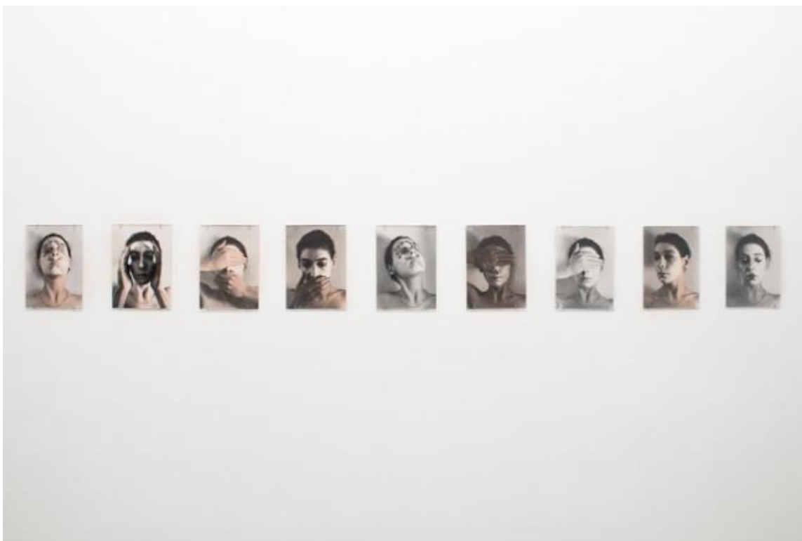
Slika 13. Janice Guy, Untitled, 1976.

Janice Guy je umjetnica je i galeristica rođena 29. siječnja 1953. godine u Velikoj Britaniji. Bavi se fotografijom te fotografira uglavnom autoportrete. Često odabire samu sebe kao subjekt vlastitog umjetničkog rada. Fotografira vlastiti lik u okolnostima koje sama izabire te na taj način preuzima kontrolu nad vlastitim tijelom. Kroz svoje autoportrete prenosi vlastite osjećaje i misaona stanja te oni nastaju ne samo za promatrača, nego primarno za samu umjetnicu. Njen cilj je prikaz vlastitog mikrosvijeta kroz medij fotografije 43 , s čime se lako mogu poistovjetiti jer je to često i moj cilj pri izradi umjetničkih radova.