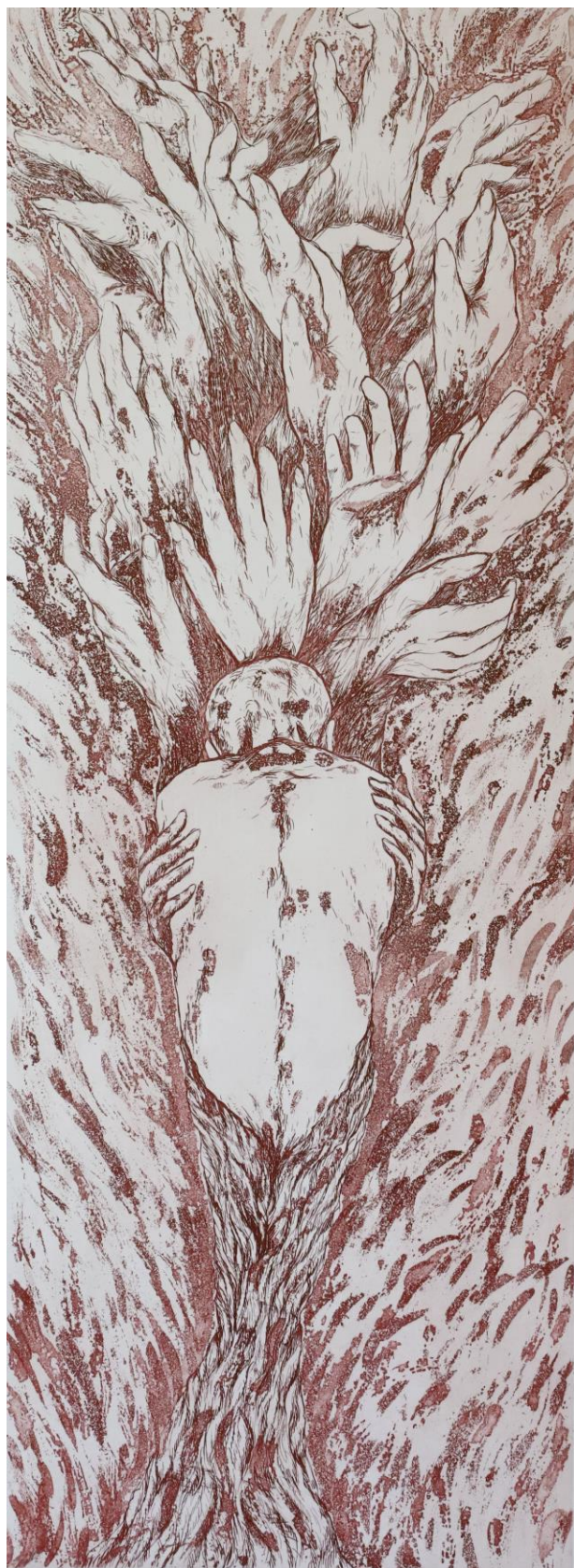
Slika 23. Završni otisak u crvenoj boji, „Zagrljaj“, 70 x 25 cm, kombinirana tehnika, Petra Arežina, 2023.