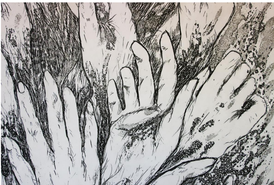
Slika 25. Detalj iz grafičkog lista „Zagrljaj“, kombinirana tehnika, Petra Arežina, 2023.