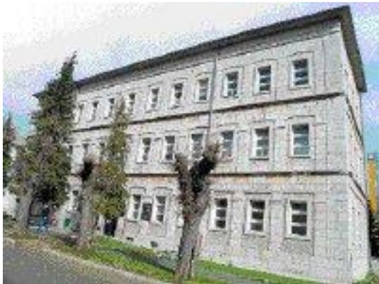
Slika 3. Đački dom u Gospiću