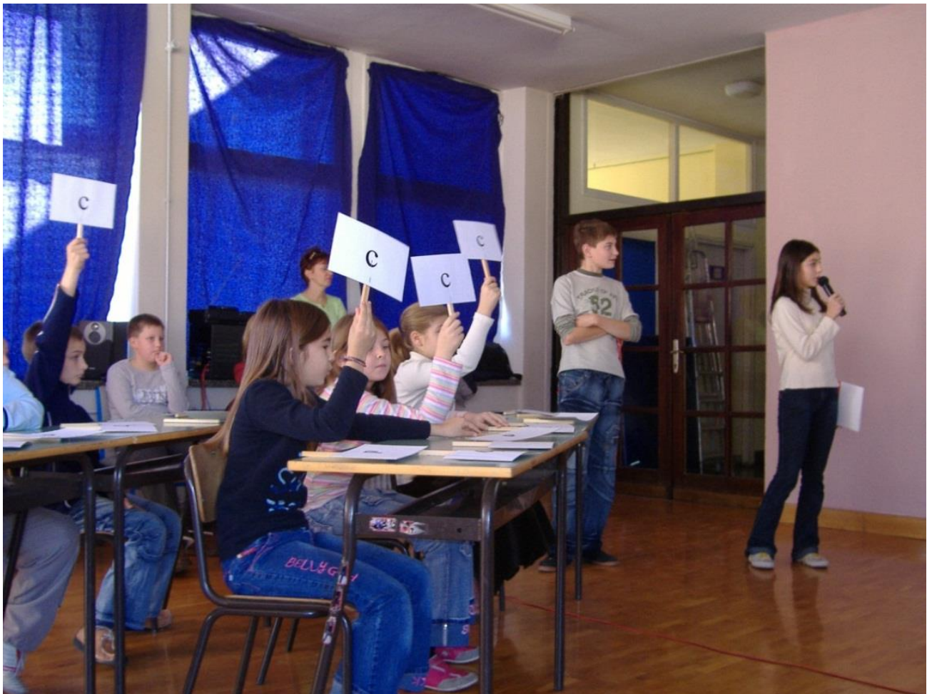
Prilog 2. Primjer kviza Šegrt Hlapić održanog u POŠ Ogulin