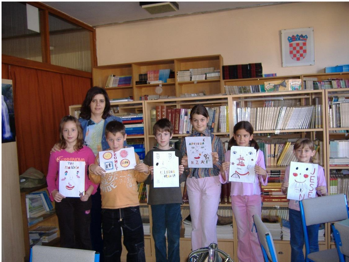
Prilog 6. Igrokaz Mladih knjižničara kojim se učenike prvih razreda educiralo o pravilnom odnosu prema knjigama