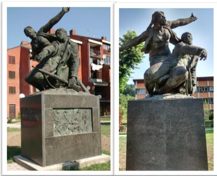
Slika 02. Spomenik Palim borcima NOB-a i žrtvama fašizma Srpske Moravice

Na takav način nastao je spomenik Palim borcima NOB-a i žrtvama fašizma 1941-1945. podignut 1951. godine u tadašnjim Srpskim Moravicama. Djelo je to kipara Velibora Mačukatina, jednog od istaknutih kipara poslijeratnog kiparstva. Spomenik se zasniva na realističkom prikazu generalno sažetih volumena likova koji dramatičnim gestama posežu u prostor da bi