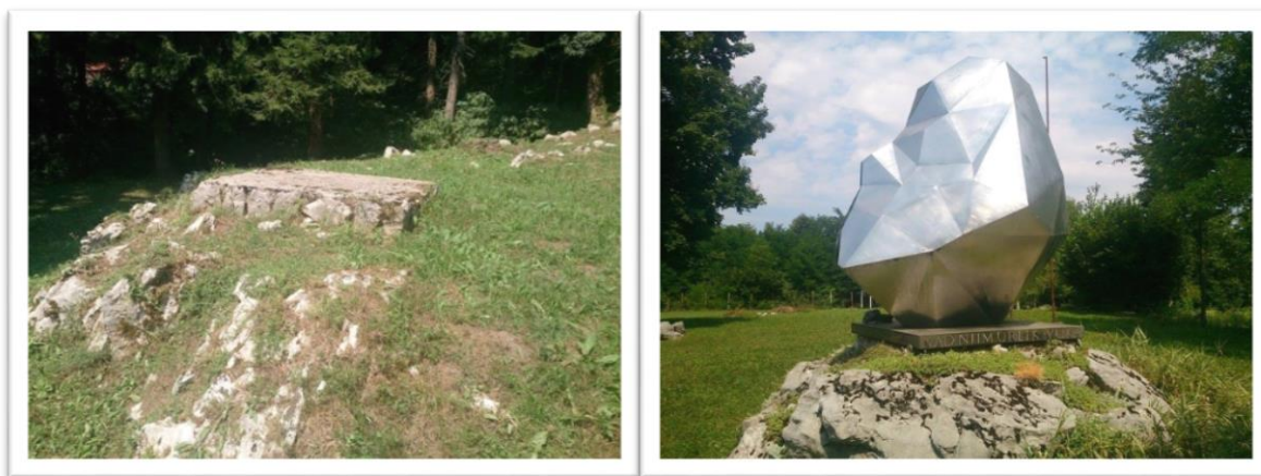
Slika 06. Nekadašnje mjesto spomenika; spomenik danas

Iako je ovo djelo rađeno pedesetih godina 20. stoljeća, 40 ne izgleda kao i većina djela nastalih u tom vremenu - monumentalni spomenici koji teže pokretu, dinamici i ističu se u prostoru u kojem se nalaze. U takvim okvirima nastao bi spomenik u liku Ivana Gorana Kovačića kako ponosno stoji na postolju, vjerojatno u jednoj ruci držeći knjigu, a u drugoj pušku, prosječne visine 3 metra. No, ovo djelo sasvim je drugačije od ovih tipičnih spomenika. Razlikuje ga to što, kao prvo, nije nastao na temu Narodnooslobodilačke borbe, rata već u ime Ivana Gorana Kovačića, pjesnika i antifašističkog borca. Drugo, djelo je apstraktnog oblika, za razliku od ostalih realističnih spomenika diljem Gorskog kotara. „Početkom 50-ih godina političke promjene u Hrvatskoj (odnosno u tadašnjoj Jugoslaviji) uvjetovale su stvaranje nove kulturne klime, a kao jedno od važnijih obilježja u navedenom razdoblju moguće je istaknuti promjene manifestirane unutar umjetničke sfere koja je tada imala izuzetan politički značaj.“ 41 Socijalistički modernizam okarakteriziran je „relativnom liberalnošću sustava, otvorenošću granica i slobodnom razmjenom ideja, te politikom nesvrstanosti...“ 42 U takvim uvjetima nastalo je djelo Vojina Bakića koje je otkriveno 04.