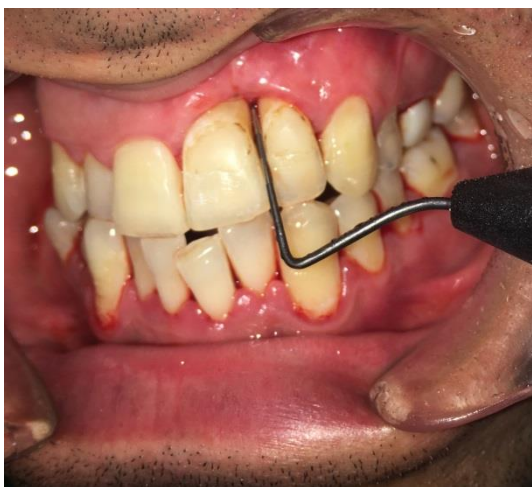
Slika 7. Klinička situacija šest mjeseci nakon operativnog zahvata. PPD 22 mezijalno iznosi 2 mm.