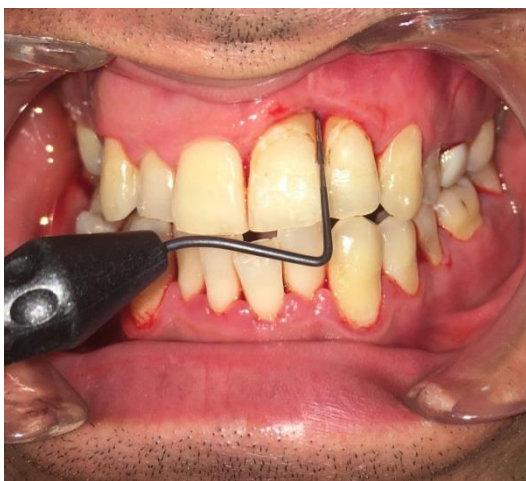
Slika 8. Klinička situacija šest mjeseci nakon operativnog zahvata. PPD 21 distalno iznosi 2 mm.